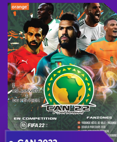
e-CAN 2022 Orange Cameroun