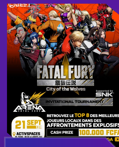
Fatal Fury Arena SNK Japon