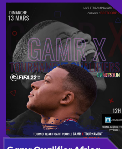
Gamr Qualifier Africa Gamr X Nigéria