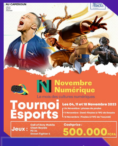
Novembre Numérique IFC Cameroun

Nous avons collaboré avec des acteurs majeurs comme Orange Cameroun, SNK Japon, Activspaces, Metalking et Ed Gaming pour organiser des événements d'envergure : Novembre Numérique IFC, E-CAN 2022, TGV Douala Grand Mall, entre autres. Ces collaborations ont permis de fédérer de larges audiences, renforcer la cohésion sociale et positionner nos partenaires comme des pionniers de l'innovation digitale.