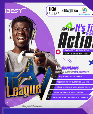
TGV League Douala Grand Mall